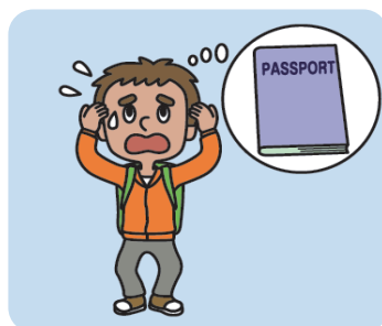
護照、信用卡遺失或遭竊