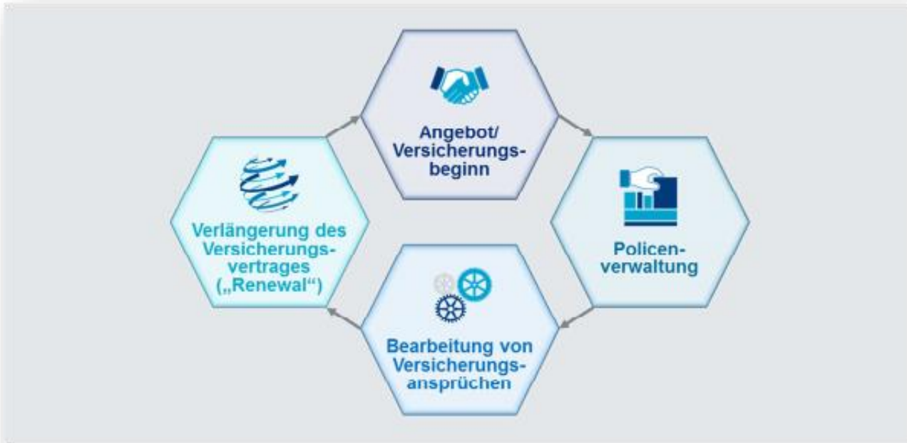
GRAFIK 2: FLUSS PERSONENBEZOGENER DATEN DURCH DEN VERSICHERUNGSLEBENSZYKLUS